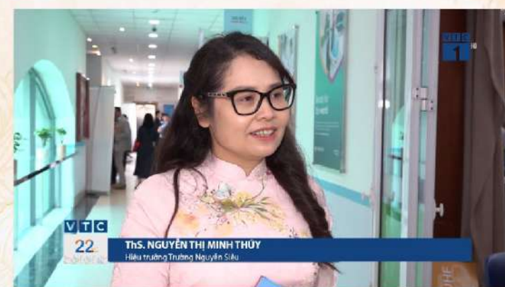
Chương trình "22h" phát sóng ngày 23/11/2024 trên VTC1