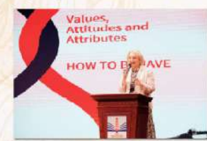
Trong cuốn sách Học tập siêu hiệu quả, GS Deborah Eyre giới thiệu các bài học nổi bật từ trải nghiệm của mình trong việc dạy học. Làm thế nào để học sinh của mình trở thành những người học tập siêu hiệu quả? Làm thế nào để trường học của mình có chất lượng cao, xứng tầm đẳng cấp thế giới?

Hiệu quả của việc dạy gì mà dạy như thế nào chỉ có thể đạt được khi giáo viên có sự kỳ vọng đúng vào học sinh của mình.