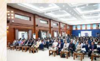
Diễn đàn thu hút sự tham gia của đông đảo các chuyên gia giáo dục trong nước và quốc tế

Diễn đàn là một trong chuỗi hoạt động của Trường Nguyễn Siêu nhân dịp kỷ niệm 10 năm trường chính thức gia nhập hệ thống các trường phổ thông quốc tế của Đại học Cambridge (Vương quốc Anh) với mã số VN23B.