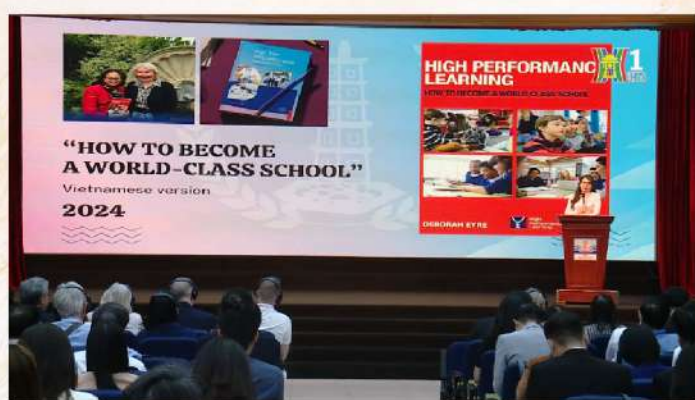
Chương trình "Giáo dục và Đào tạo" phát sóng ngày 24/11/2024 trên Hà Nội 1